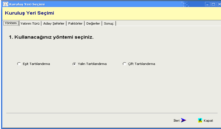
Şekil 2. Kullanılacak Yöntemin Seçildiği Pencere

Adım Adım ... komutu işletildiğinde ekrana adımlardan oluşan bir pencere gelir. Birinci adımda, kullanılacak yöntem seçilir (Şekil 2).