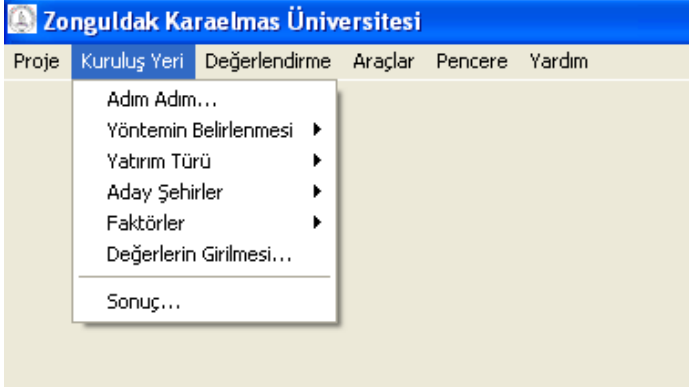
Şekil 1. Kuruluş Yeri Menüsü

Adım Adım ... komutu işletildiğinde ekrana adımlardan oluşan bir pencere gelir. Birinci adımda, kullanılacak yöntem seçilir (Şekil 2).